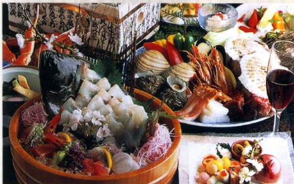
日本海の魚介料理