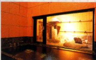
人気の貸切風呂(要予約)もご用意しております。

かがり火がゆらぐ門をくぐるとそこには、 やすらいだぬくもりを感じる宿「有楽」。 身も心も癒す石組み露天風呂や 人気の貸切風呂。 名峰大山の山の幸、日本海の幸の数々が おりなす旬の味覚。 そして心からのおもてなしと 日本古来の風情をのこした 落ち着きのある和の趣は、 そつと貴方をやさしく、 そして懐かしみので包み込みます。