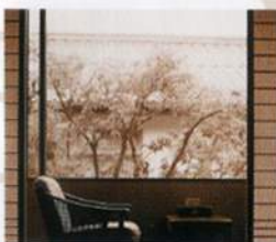
和の趣を感じる客室

和の趣漂う落ち着きのある客室は、古き良き日本の姿を思い出させてくれる癒しの間。ふと外を見据えて、情緒溢れる四季をも感じてください。