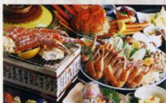
山陰の味覚「蟹づくし」

山陰を代表する味覚のずわい蟹を始め、季節を通じてお楽しみいただける山々の恵みと日本海の旬の幸を心ゆくまで堪能ください。